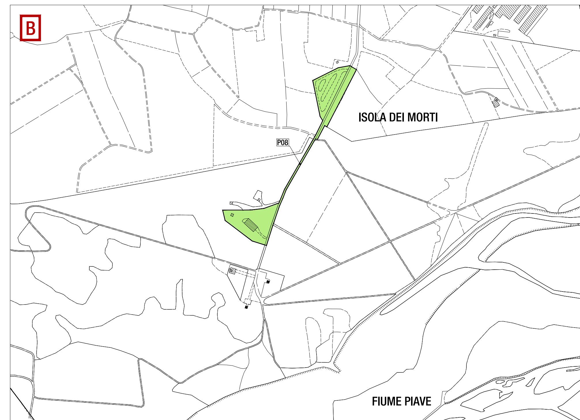
PLANIMETRIA STATO DI FATTO - GRADO DI ACCESSIBILITÀ - AREA B